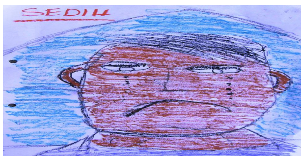
Gambar 1. Hasil lukisan/luahan Chak pada sesi pertama (sesi membina hubungan)

Gambaran yang dapat dilihat adalah wajah seorang yang sedih. Berdasarkan luahan Chak, tema sedih ini dipilih kerana dia sering dimarahi guru dalam bilik darjah. Menurut Chak, penggunaan warna tidak melambangkan kepada sebarang perasaannya. Dia hanya memilih warna tersebut kerana meminatinya. Dalam hasil lukisan ini, lima warna dikenal pasti iaitu hijau, coklat, hitam, ungu dan juga merah.